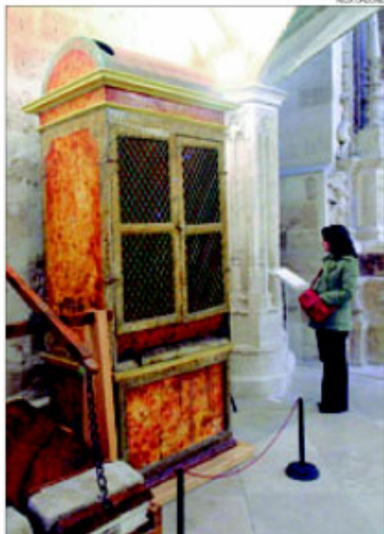
► La peça ► L'orgue del segle XVII, al museu de Valladolid.

Les desventures de l'orgue van ser posades sobre la taula el 27 d'octubre passat al Parlament de Catalunya per reobrir, per part de Convergència i Unió, el debat sobre l'espoliació que es porta a terme a través de les dacions. D'ell, se sap on és. De moltes altres peces, no. ■