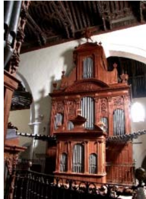
Façana de l'orgue restaurat de Francisco Rodríguez

Per a qualsevol altra informació no dubteu de contactar amb nosaltres.