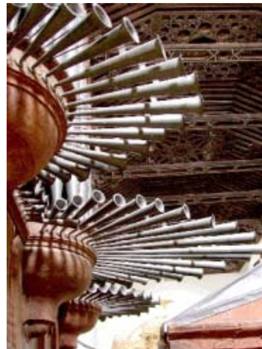
Trompeteria de l'orgue Juan de Echevarría

A l'hora convinguda per al dinar vam anar cap a Castelló d'Empúries. Els organitzadors ens havien reservat taula en un magnífic Hotel-Restaurant, on ens van servir un exquisit dinar. Cap a les 16.30 h vàrem poder entrar a l'Església de Santa Maria on ens donà la benvinguda el rector, Mn. Narcís Costabella. L'edifici destaca per la seva monumentalitat. Va ser construït per sobre de l'església romànica primitiva, i de la qual encara queden alguns vestigis, com els primers pisos de la torre campanar o la gran pica baptismal. A l'interior de l'església destaca el retaule gòtic de l'Altar Major, d'alabastre. És una de les millors mostres de l'escultura gòtica catalana de la segona meitat del S. XV. Hi ha la imatge de la patrona de la vila, la Mare de Déu de la Candellera. A més de la Capella Major, existeixen altres vint-i-cinc capelles laterals, de les quals destaca la Capella dels Dolors, amb el seu retaule barroc. De visita obligada per tots era l'orgue monumental! Està situat en una galeria barroca, decorada amb figures de sants i àngels músics, sostinguda per quatre grans pilars que emmarquen la porta principal. L'orgue és considerat "un dels més grans i complets instruments de l'època a l'Estat Espanyol i països veïns, realment digne d'una catedral."