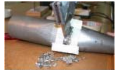
Restauració de tubs