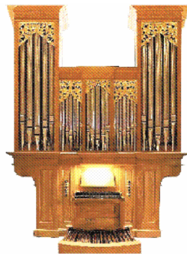
Organos Spaeth S.L. España