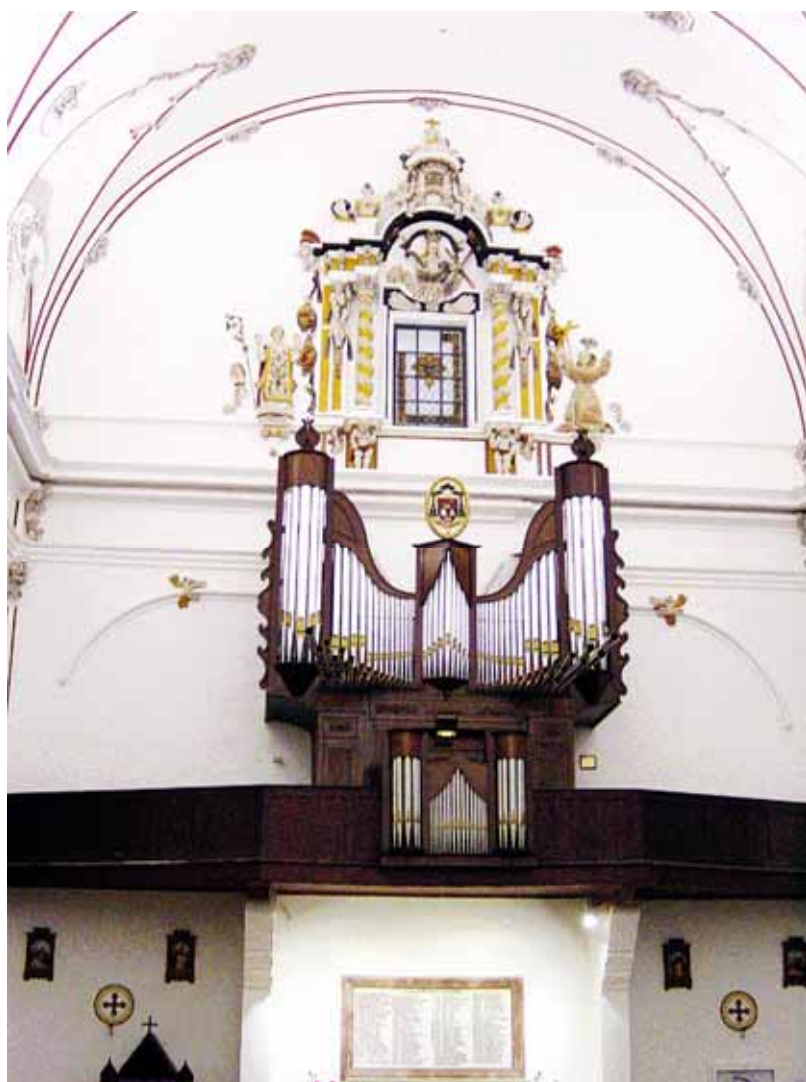
Orgue de la Catedral d'Eivissa